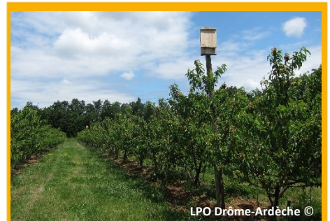
Gîtes "boite aux lettres" en verger de pêchers